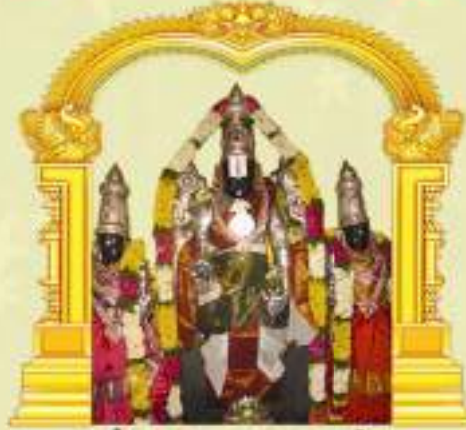
మేళ చెఱువు- మహాసెమెంట్ శ్రీకళ్యాణ వేంకటేశ్వరస్వామి

శ్రీశ్రీశ్రీ త్రిదండి చిన్న శ్రీమన్నారాయణ రామానుజ జీయర్స్వ్యామివారి మంగళాశాసనములతో...!