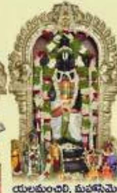
యలమంచెరి, మహాసెమెంట్లో స్వామి లక్ష్మీ సమేత శ్రీవేంకటేశ్వరస్వామి అలయము