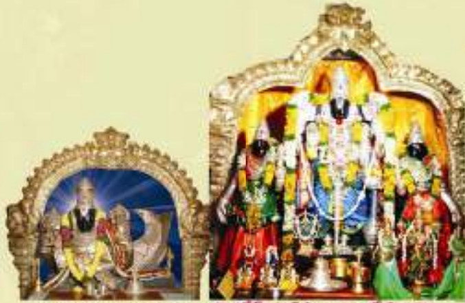
శ్రీమత్స్వ నారాయణ పేరుమాతే వైచిత్రీమీ హాట్ ప్రాంగణములో కొలువైన శ్రీ భూ సమేత లక్ష్మీనారాయణ స్వామి