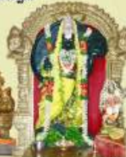
మదీరాగుడ - జ్యోతిర్ హనుమాన్ అలయము